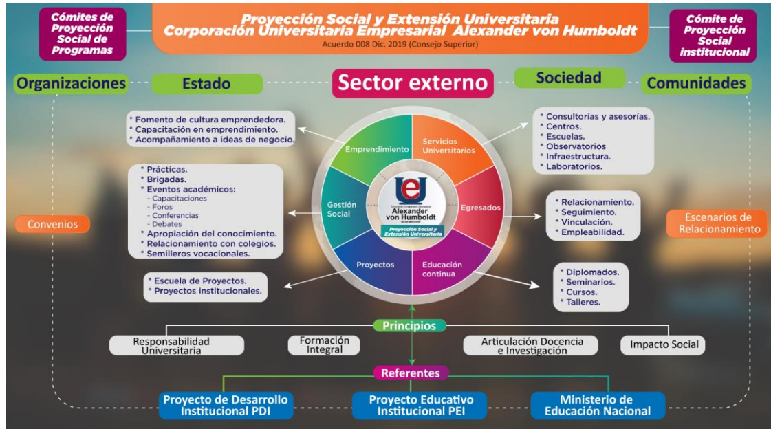
Figura 2. Proyección Social Institucional y Extensión Universitaria.

actores internos (docentes, estudiantes, directivos, coordinadores y director de proyección social) y otros externos (egresados, entidades de cooperación, escenarios de práctica, grupos de interés, entre otros) (CUEAvH, 2019).